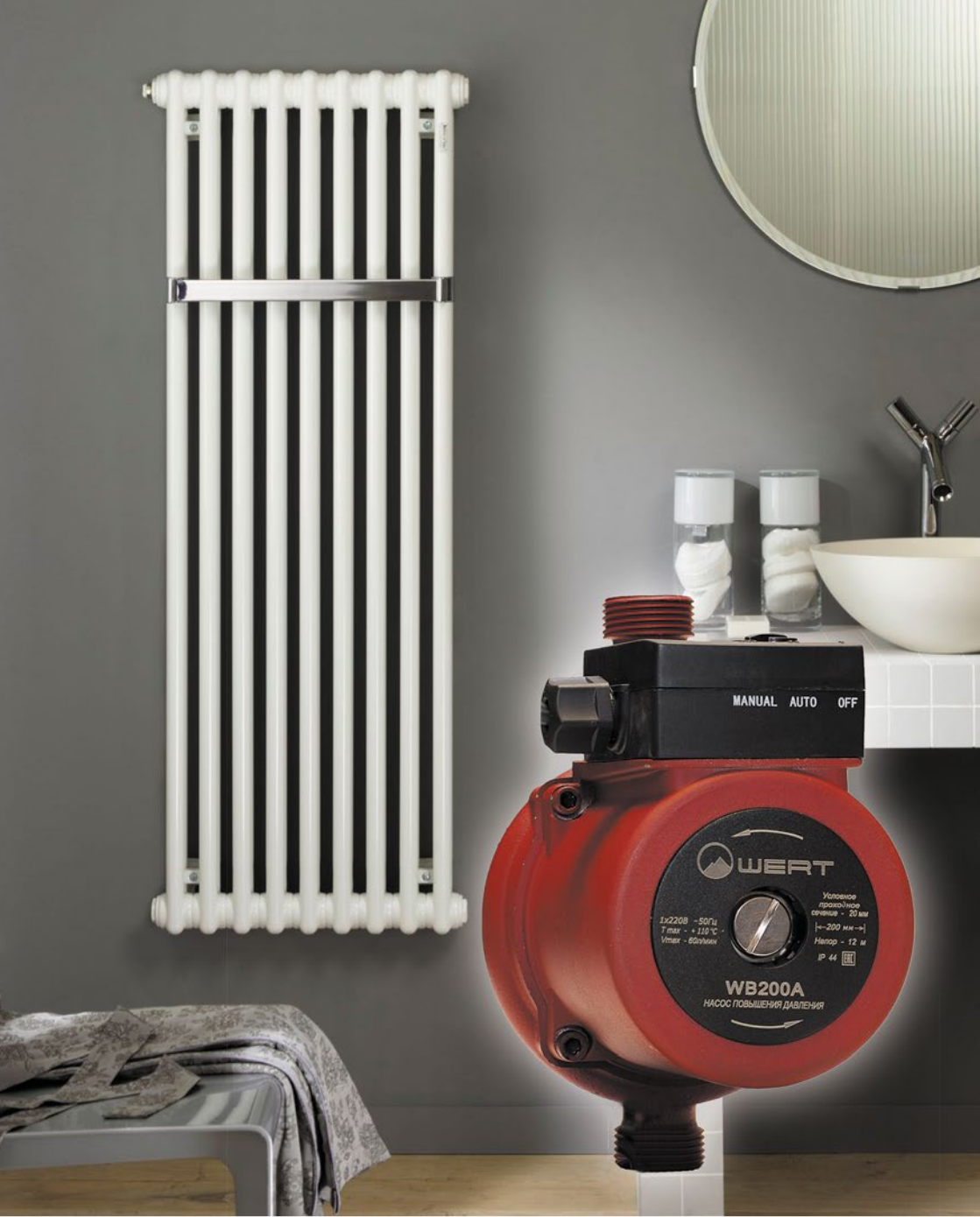
Насосы повышения давления WertRus серии WB